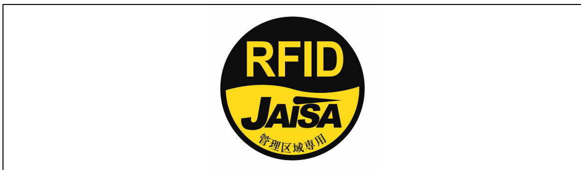
図3 管理区域専用RFID機器用ステッカー

注1： ここでは、公共施設や商業区域などの一般環境下で使用されるRFID機器を対象としており、工場内など一般人が入ることができない管理区域でのみ使用されるRFID機器（管理区域専用RFID機器）については対象外としている。なお、管理区域専用RFID機器については、（一社）日本自動認識システム協会において、一般環境への流出を防止するため、取扱説明書等に注意書きを記載するとともに、管理区域専用RFID機器用ステッカー（図3）を貼付することとされている。