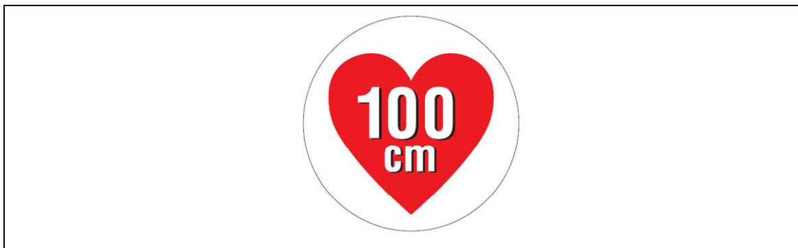
図2 据置きタイプRFID機器（高出力型950MHz帯パッシブタグシステム）用ステッカー

注1： ここでは、公共施設や商業区域などの一般環境下で使用されるRFID機器を対象としており、工場内など一般人が入ることができない管理区域でのみ使用されるRFID機器（管理区域専用RFID機器）については対象外としている。なお、管理区域専用RFID機器については、（一社）日本自動認識システム協会において、一般環境への流出を防止するため、取扱説明書等に注意書きを記載するとともに、管理区域専用RFID機器用ステッカー（図3）を貼付することとされている。