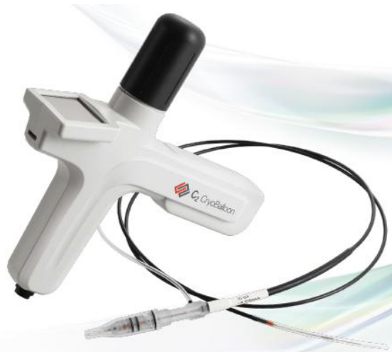
クライオバルーンコントローラとバルーンカテーテル