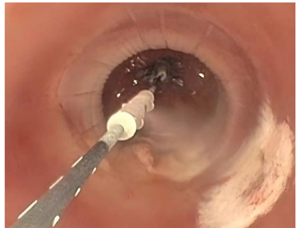
冷凍アブレーションの様子